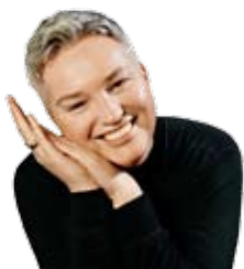
BRITA MØYSTAD ENGSETH programleder på TV Norge